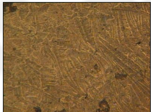
Рис. 1.в. Фрактальна структура ротової рідини після прослуховування музики типу жорсткого року

З фотографій випливає, що в спокійному стані організму тверда фаза ротової рідини має фрактальну структуру. Фрактальну структуру дають практично всі природні ліотропні