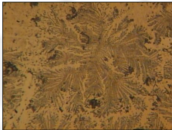
Рис. 1.а. Фрактальна структура ротової рідини в нормі

Отримані структури твердої фази ротової рідини вивчалися за допомогою оптичного мікроскопа. Використовувався оптичний мікроскоп марки NU-2E, фірми "Карл Цейсс", Германія, при лінійному збільшенні рівному 100-120 кратному. Отримані фотографії твердої фази ротової рідини представлені на фото 1 (а, б, в).